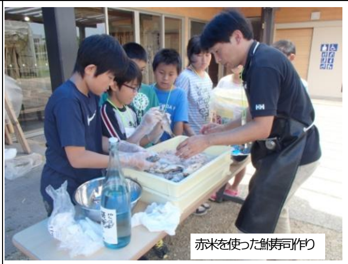
赤米を使った鮭寿司作り