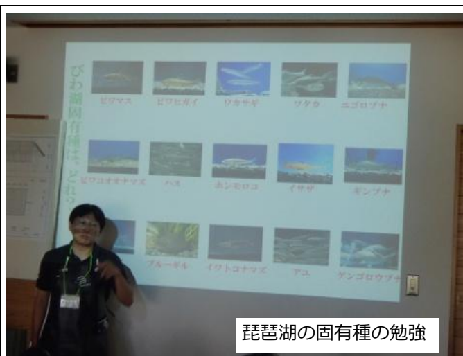
琵琶湖の固有種の勉強

メンバーが協力をしながら、魚のウロコや頭、内臓を取り下準備をして作った料理はとても美味しかったです。鮎寿司は完成まで半年ほどかかりますが、完成して食べるのが楽しみです。