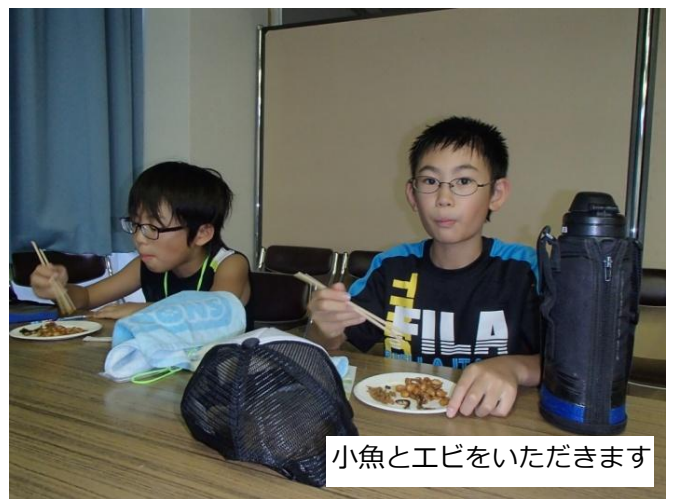
小魚とエビをいただきます

次回第4回目の活動では、弥生人の肉料理を食べる活動ということで、イノシシとシカ肉を食べます。