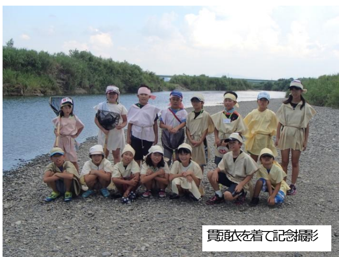
賞状を着て記念撮影