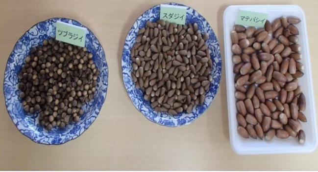
ツブラジイやスタジイ、マテバジイという木の实