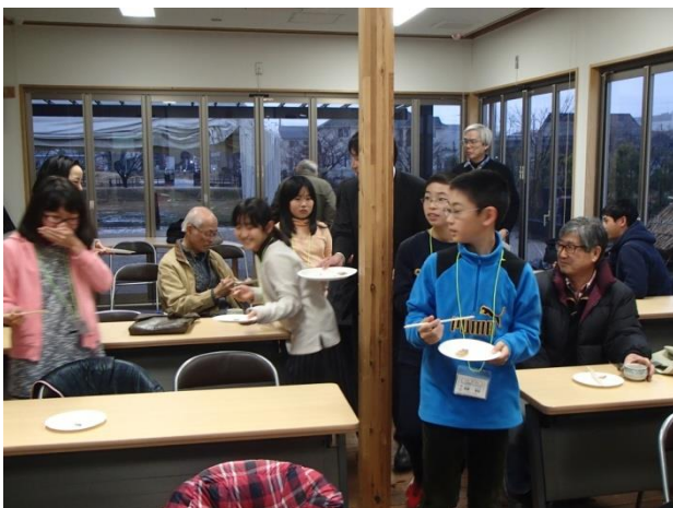
講座の受講生に鮎寿司をふるまうキッズクラブのメンバー